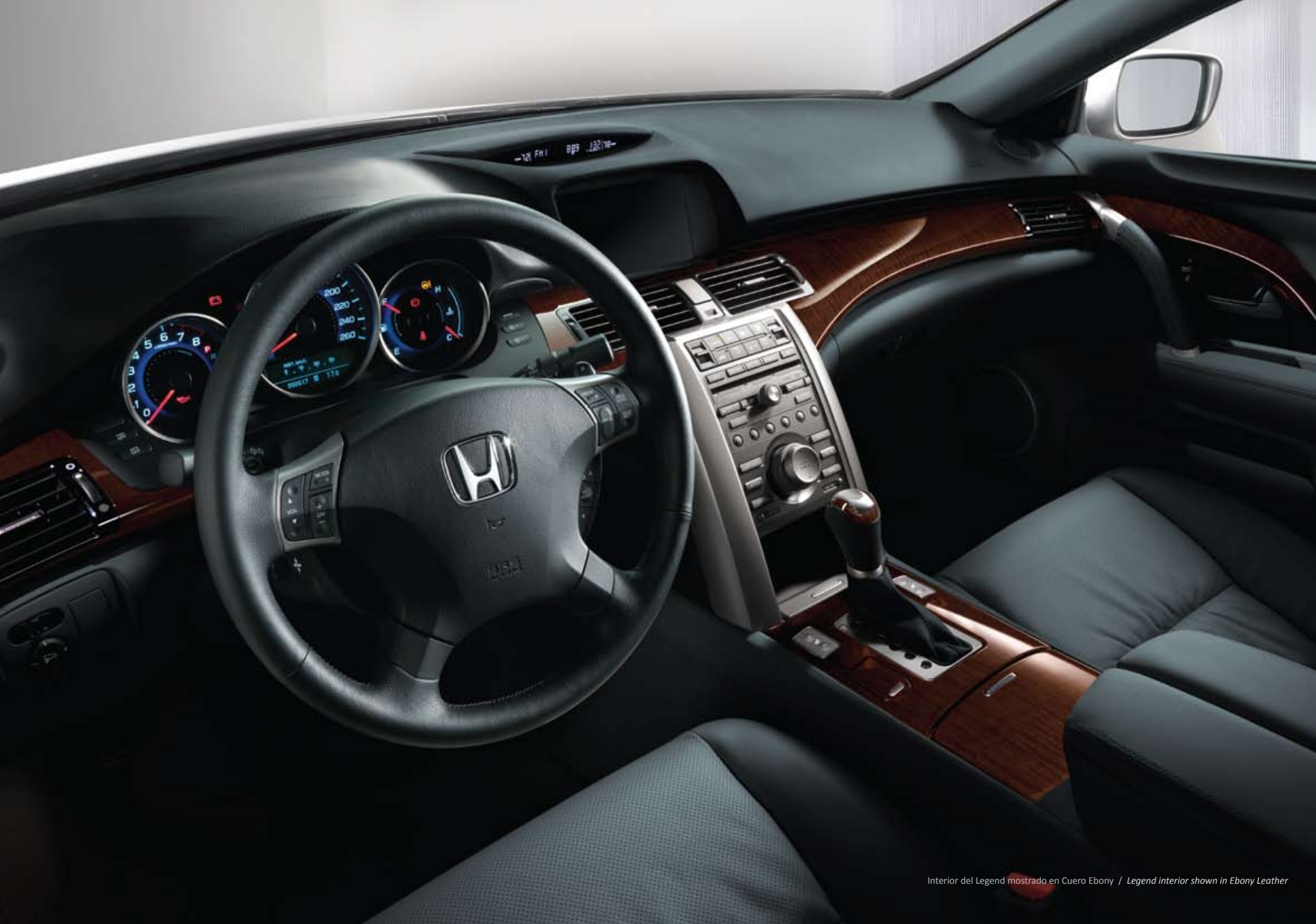
Interior del Legend mostrado en Cuero Ebony / Legend interior shown in Ebony Leather