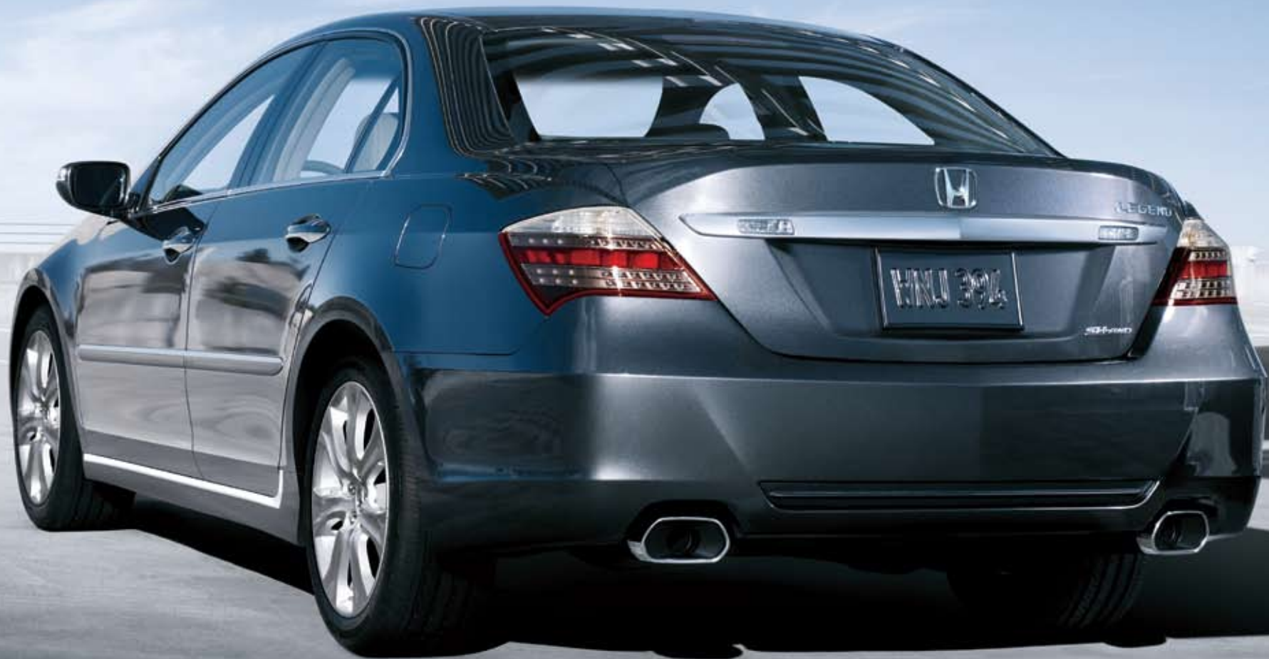
Legend mostrado en Silver Jade Metallic / Legend shown in Silver Jade Metallic